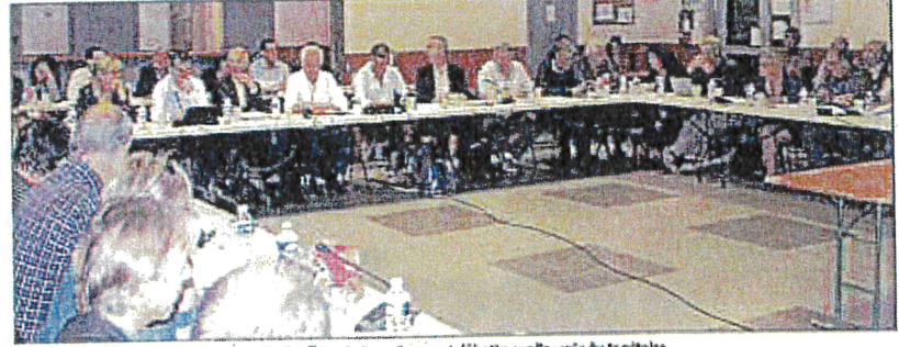
Les élus de la CCPL, jeudi, dans la salle des fêtes de Saussènes, ont débattu sur l'avenir du territoire.

Pays de Lunel | Les élus ont planché sur le Schéma de cohérence territoriale. Ou comment exister entre Nîmes et Montpellier.