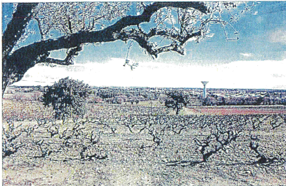
■ Les élus de la communauté de communes du Pays de Lunel planchent sur le schéma de cohérence territoriale (Scot) qui devra être validé d'ici avril 2017.