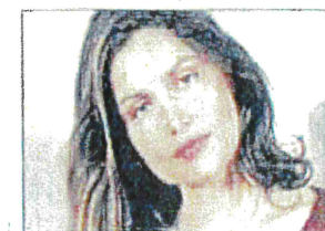
■ La présidence du jury remettra les prix de l'équival en sole au Corum.