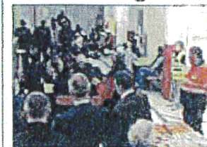
■ A Saint-Basille-de-Putois, 43 hommes, essentiellement des Soudanais, sont arrivés.