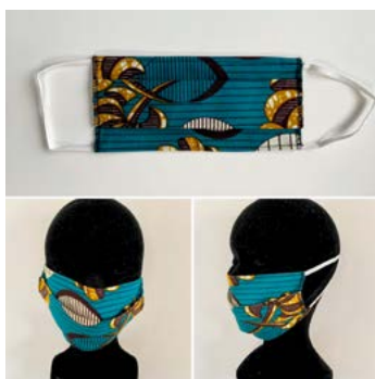
L'atelier de Virginie