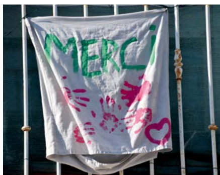
Une banderole à Lunel, rue de Verdun

Ralf : "Merci pour votre engagement de tout le jour bravo 🙌❤️"