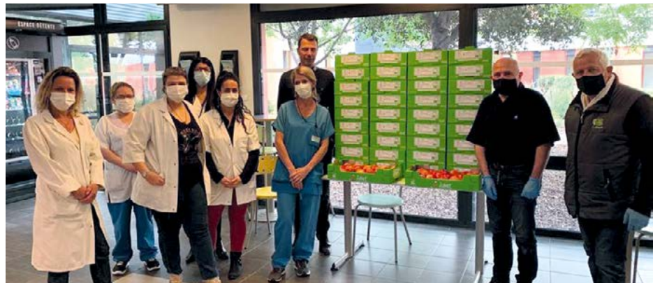
De nombreux dons pour le personnel de la clinique Via Domitia. Ci-dessus des pommes de la SICA