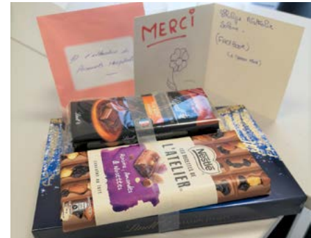
Du chocolat pour le personnel de la clinique