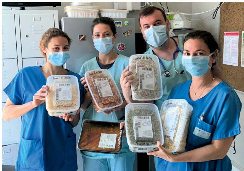
Pendant le confinement, le restaurant Poivre Rouge a offert de nombreux repas au personnel soignant