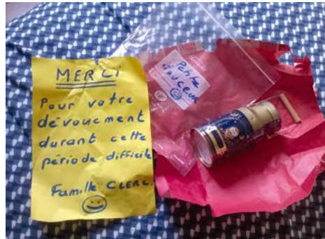
Des douceurs pour nos éboueurs