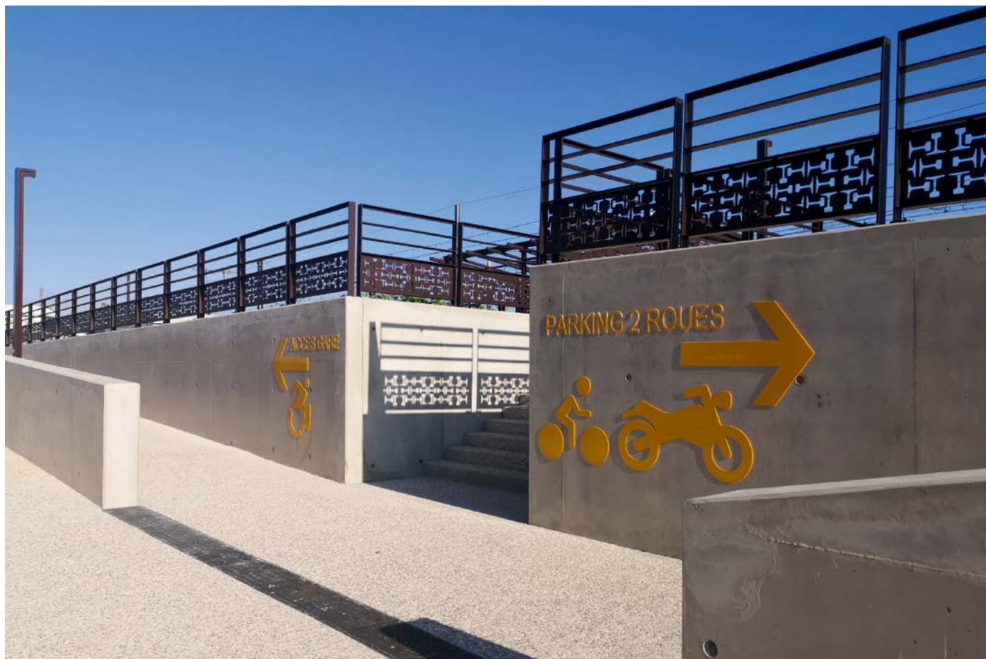
Aménagement du PEM rue de Verdun

Si la crise sanitaire a perturbé l'avancée du chantier, le Pôle d'Échange Multimodal a désormais pris son allure finale avec l'ouverture du parking sud et de la rue de Verdun.